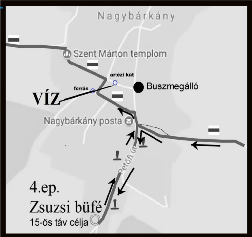
Nagybárcány 4. ep. és SZL15 célja + utolsó ivóvíz vételezési lehetőségek